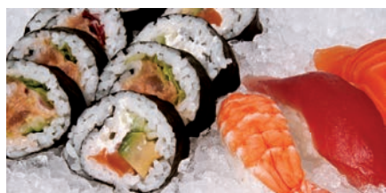
DRY ICE | HIELO SECO | PERLES OU GLAÇONS - ICE QUEEN 50C/85C

There is a full range of ITV storage bins to choose. The ICE QUEEN flaker comes complete with water filter, scoop and bin ice distributor. It is available in 220v/50Hz, 220v/60Hz, 115v/60Hz and triphase 380v and can be air or water cooled.