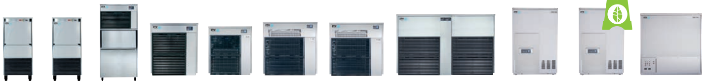
ICE QUEEN 50C ICE QUEEN 85C ICE QUEEN 135C ICE QUEEN 150 ICE QUEEN 200 ICE QUEEN 400 ICE QUEEN 550 ICE QUEEN 1100 GENERATOR IQ550 GENERATOR IQ850 CO2 GENERATOR IQ1100